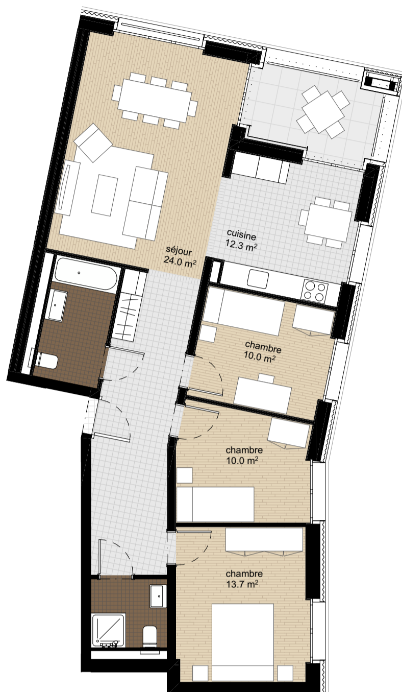
Plan de l'appartement, éch. 1:100

Surface habitable : 94.6 m 2 Surface extérieur : 7.0 m 2