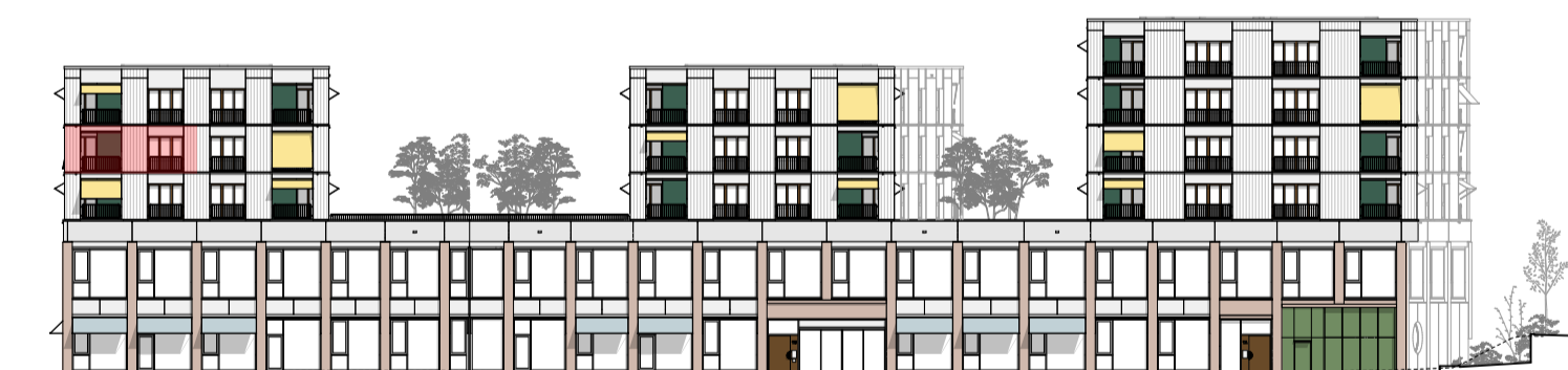
Elévation nord-ouest, éch. 1:500