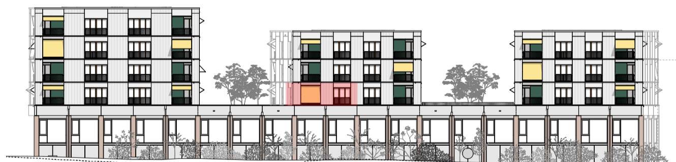
Élévation sud-est, éch. 1:500