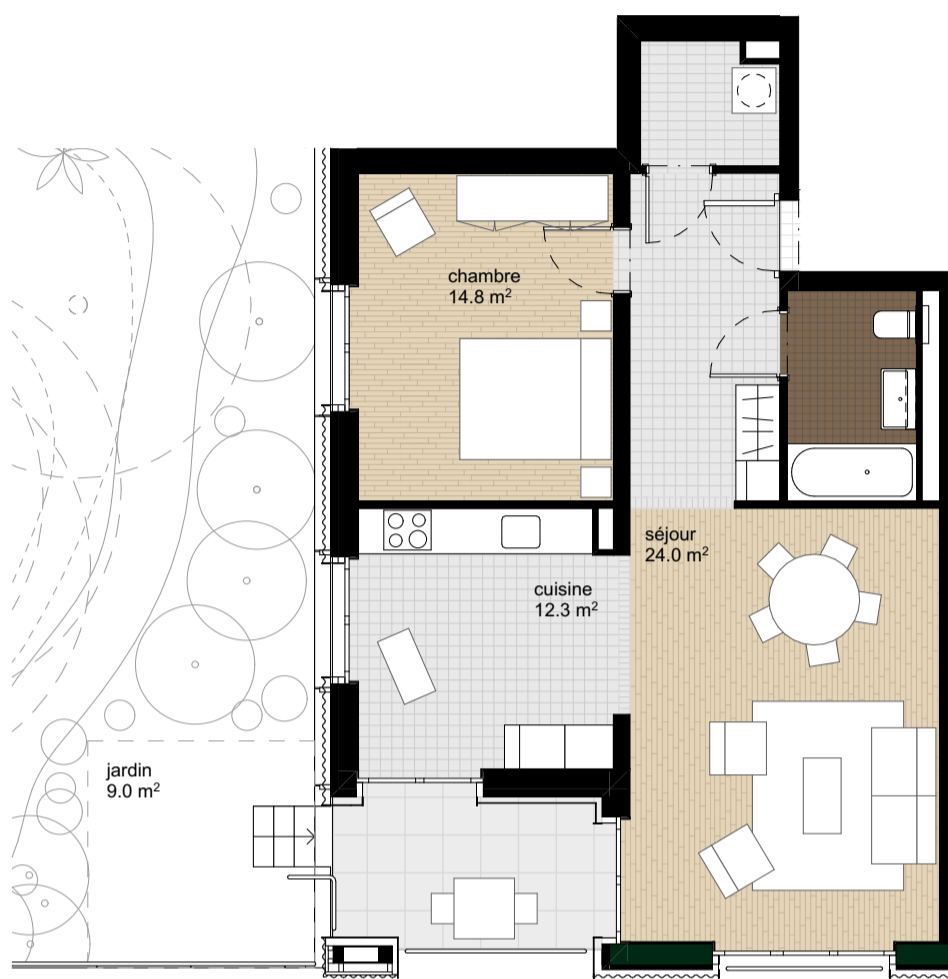
Plan de l'appartement, éch. 1:100

Surface habitable : 67.1 m 2 Surface extérieur : Balcon : 7.4 m 2 Jardin : 9.0 m 2