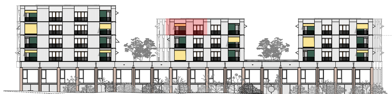
Élévation sud-est, éch. 1:500