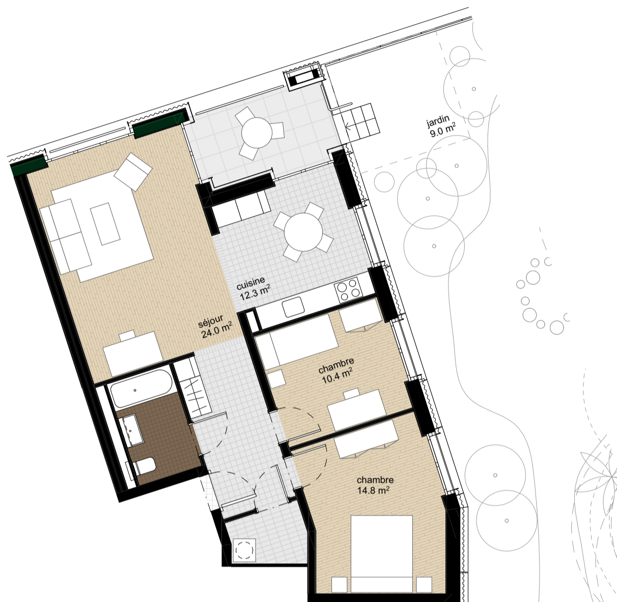
Plan de l'appartement, éch. 1:100

Surface habitable : 77.4 m 2 Surface extérieur : Balcon : 7.4 m 2 Jardin : 9.0 m 2