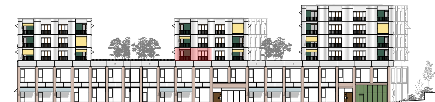
Elévation nord-ouest, éch. 1:500