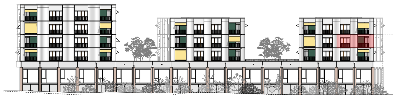
Élévation sud-est, éch. 1:500