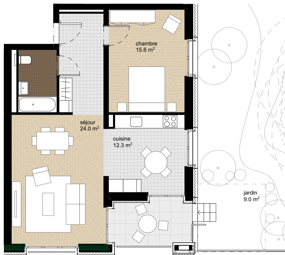
Plan de l'appartement, éch. 1:100

Surface habitable : 64.9 m 2 Surface extérieur : Balcon : 7.4 m 2 Jardin : 9.0 m 2